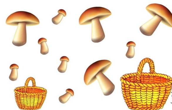
Сложи большие грибы в большую корзинку, а маленькие – в маленькую.

Разложить грибочки (овощи) по корзинкам: большие - в большую корзинку, а маленькие - в маленькую, соединяя их линиями. Можно взять разные карандаши и "собирать" большие грибы (овощи) одним цветом, а маленькие - другим.