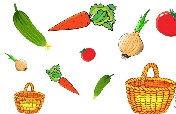
Сложи большие овощи в большую корзинку, а маленькие – в маленькую.