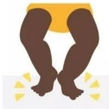
Отталкивается ногами от твёрдых поверхностей