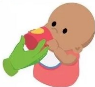
Может начинать пить из обычной чашки