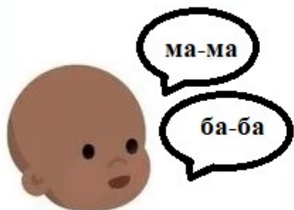
Говорит "мама" и "папа", понимая к кому обращается