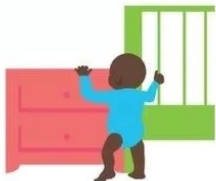
Залезает на мебель