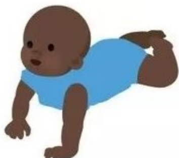
Принимает позу для ползания