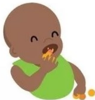
Ест самостоятельно небольшие порции еды