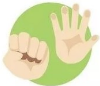
Собирает ручки в кулаки