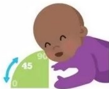
Приподнимает голову на 45 градусов