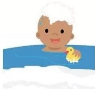
Может мыться в ванной