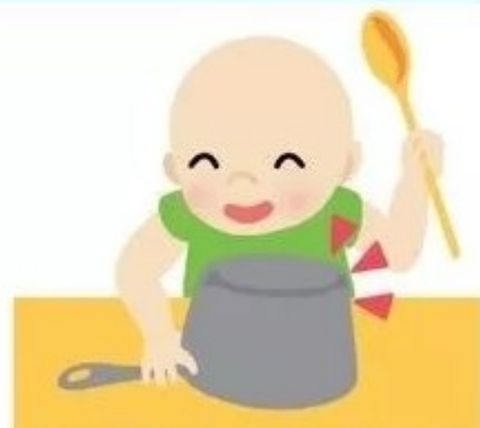
С помощью разных предметов устраивает концерты