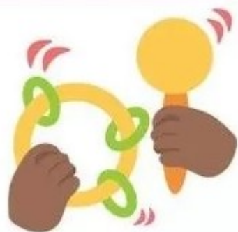
Хватает и трясет игрушки