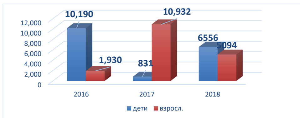
Рис.2 Общее количество обслуженных (детей и взрослых) за 2016-2018 гг. (тыс. чел).