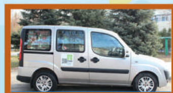
Социальное такси 48-31-77